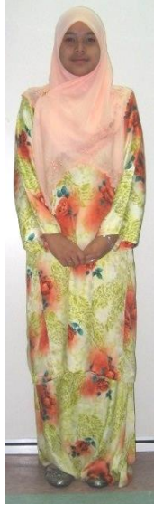
RUPADIRI SISWI - ISLAM -