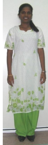
RUPADIRI SISWI - NON-MUSLIM -